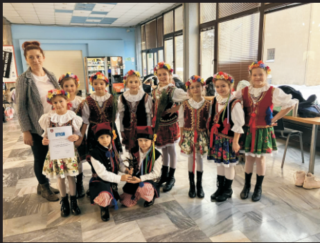
Powiatowy Przegląd Zespołów Tanecznych