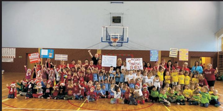
Turniej Przedszkolaków o Puchar Wójta Gminy Kamienica Polska