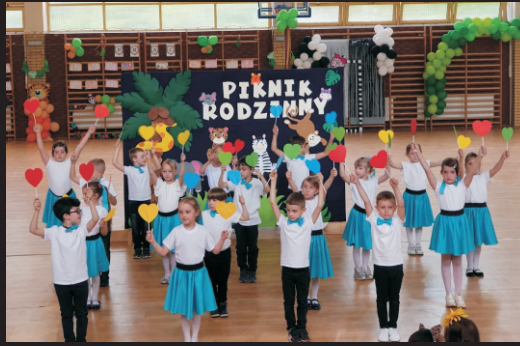
Piknik Rodzinny w Przedszkolu