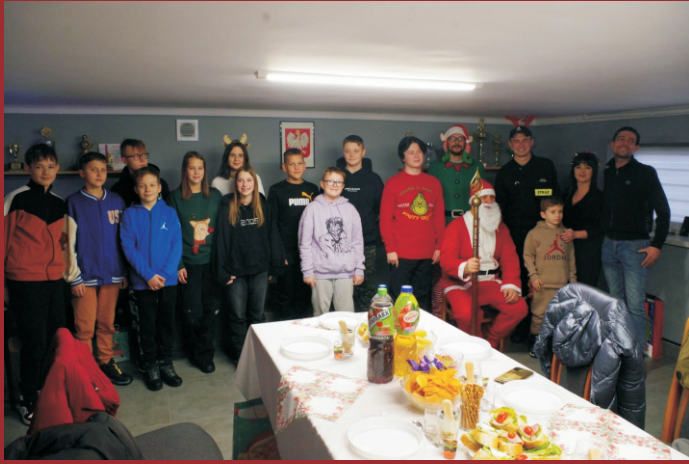
Mikołajki w OSP Zawisna