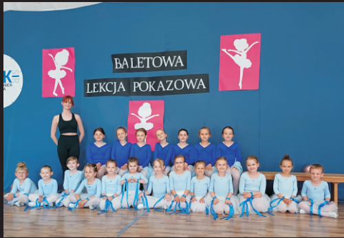
Pokazowa Lekcja Baletowa