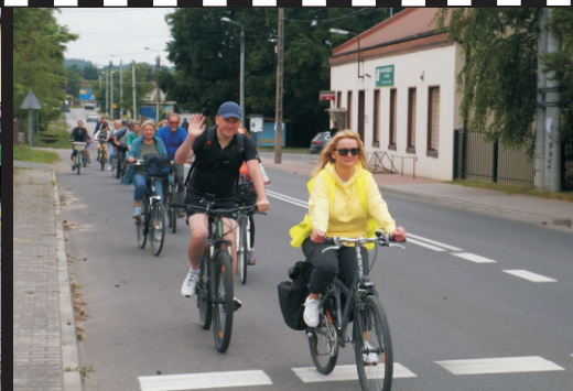
Międzypokoleniowy Rajd Rowerowy