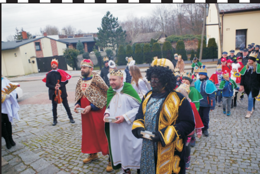
Orszak Trzech Króli