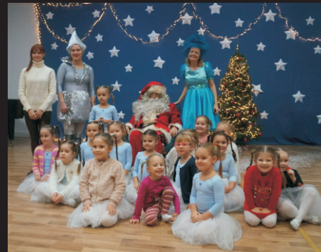
Świąteczny pokaz Ogniska Baletowego