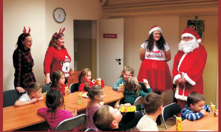
Mikołajki w Gminnym Ośrodku Kultury, Sportu i Rekreacji