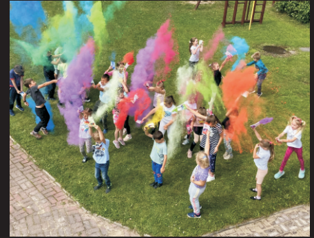
Zajęcia letnie w GOKSiR